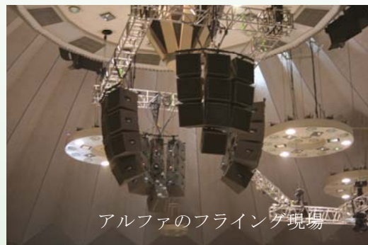
アルファのフライング現場

会社の略歴をご紹介します。 1978年（昭和53年）、市内中島公園近くのマンション一室にて、株式会社ウイークエンドは産声をあげました。さかのぼる事、数年前より、コンサートのメイキングやサポート等の活動はありましたが、音響専門のサービスを生業としたのは、この時からでした。