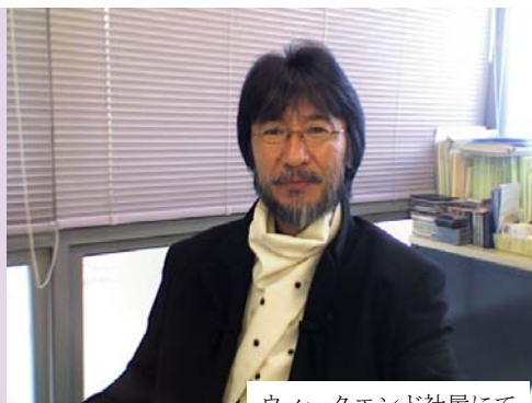
ウィークエンド社屋にて

『協会員相互の扶助の精神に元 づき協会員のために必要な共同 事業を行い、もって協会員の自 主的な経済活動を促進し、かつ その経済的地位の向上を図る』 を目標に掲げ、1999年（平 成11年）に北海道音響事業協 会を立ち上げて以来、はや10 年の歳月を数える事となりました。