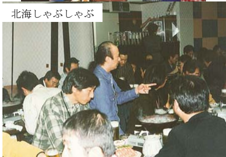
第5回記念展示会 2003年 札幌コンベンション40社展示700名来場