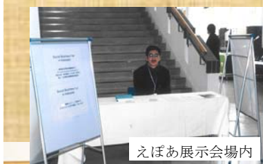
えぼあ展示会場内