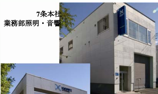
7条本社 業務部照明・音響